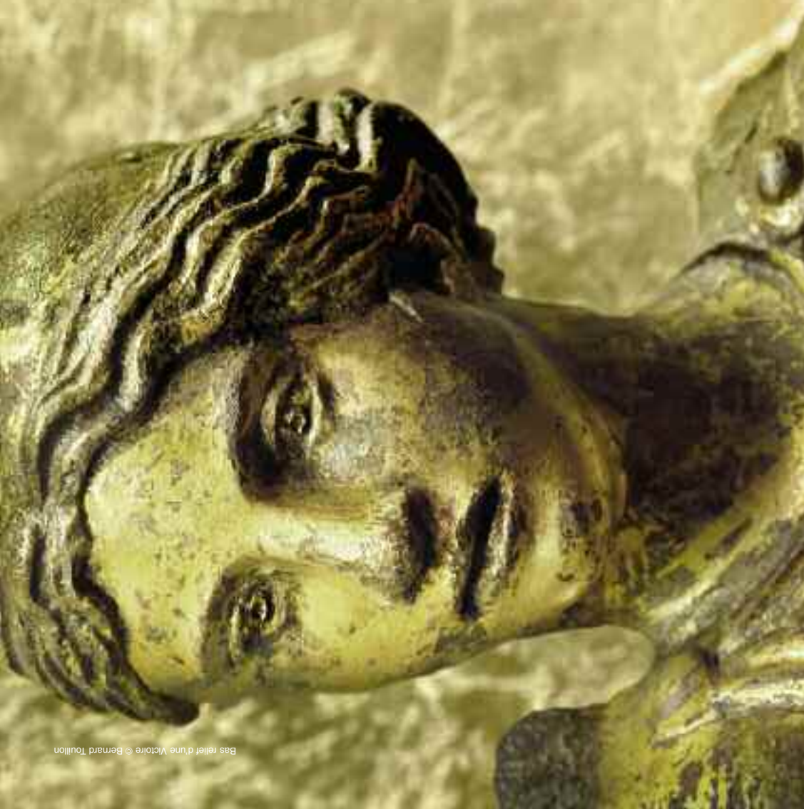
Bas relief d'une Victoire © Bernard Toullion