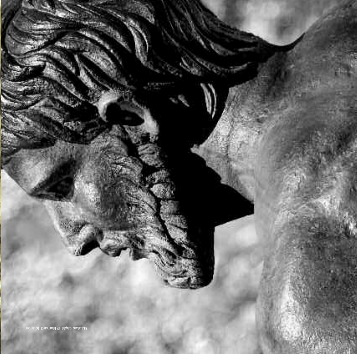
Gaulois captif © Bernard Toullion