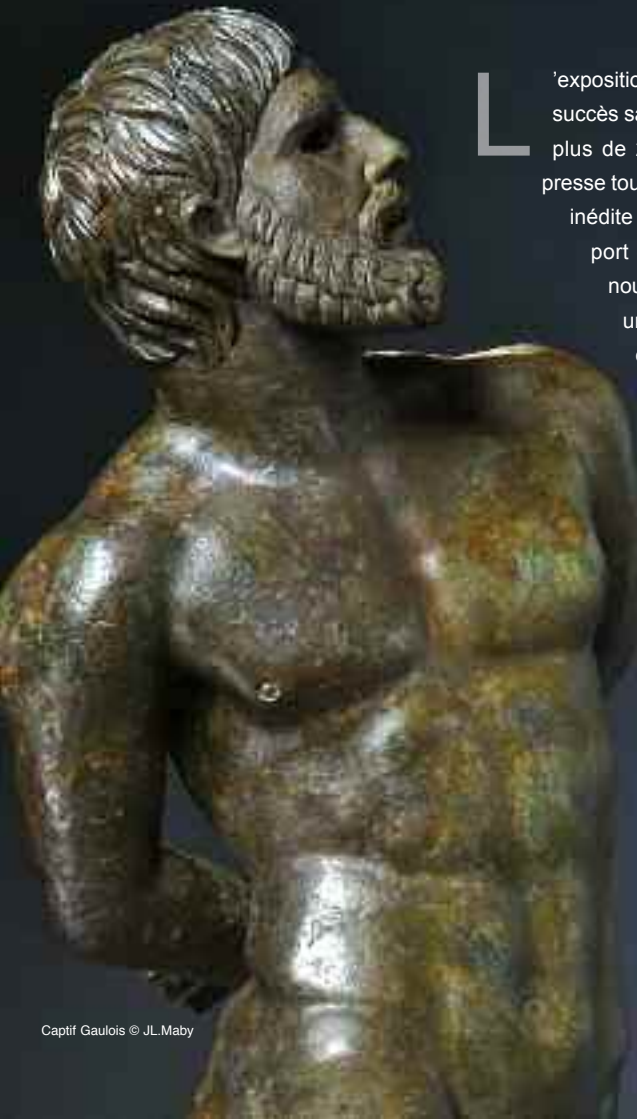
Captif Gaulois

L'exposition César, le Rhône pour mémoire connaît un succès sans précédent dans l'histoire du musée, avec plus de 200 000 visiteurs en 8 mois. Le public se presse tous les jours pour venir admirer cette collection inédite d'objets qui nous replongent dans la vie du port de l'antique Arelate. Le portrait de César - nouvelle icône de notre département - a donné une ampleur inattendue au travail méticuleux et courageux des archéologues ces vingt dernières années. Aussi, pour répondre à cet engouement, le Conseil général a décidé la prolongation de l'exposition jusqu'au 2 janvier 2011. Une telle exposition est portée quotidiennement au musée par une équipe passionnée et compétente grâce à qui un tel patrimoine peut être partagé dans les meilleures conditions. Laissez-vous surprendre par les diverses activités proposées par le musée : toutes portent le même message, celui du partage nécessaire de la connaissance et de nos cultures, d'hier et d'aujourd'hui.