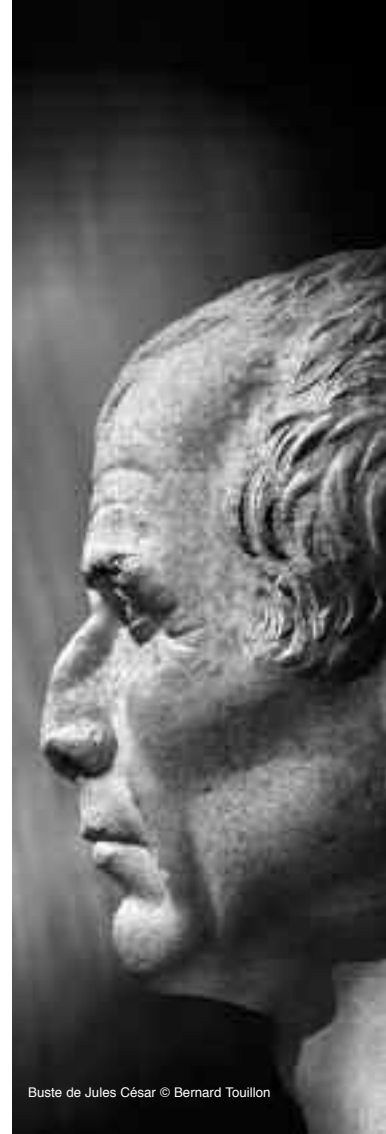
Buste de Jules César © Bernard Touillon